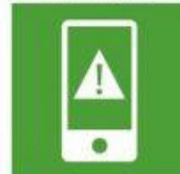
3.D. Refuerzo gestión de riesgos sanitarios