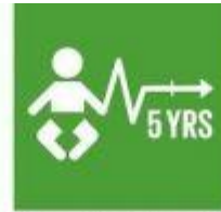
3.2. Eliminar la mortalidad infantil y neonatal