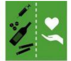
3.5. Prevención y tratamiento de sustancias nocivas