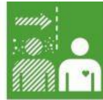
3.3. Poner fin a las enfermedades transmisibles