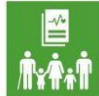
3.8. Cobertura universal y acceso medicamentos y vacunas