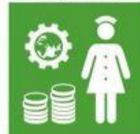
3.C. Aumento de la financiación del sistema sanitario