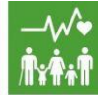
3.4. Enfermedades no transmisibles, salud mental, bienestar