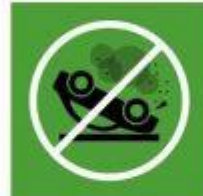
3.6. Reducción de accidentes de tráfico