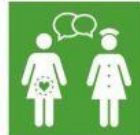
3.7. Garantía de acceso salud sexual y reproductiva