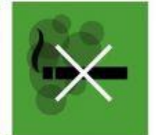
3.A. Control consumo y efectos tabaco