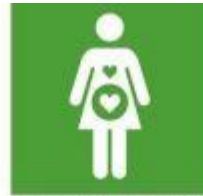
3.1. Reducir tasa de mortalidad materna