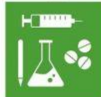
3.B. Apoyo I+D medicamentos esenciales y vacunas