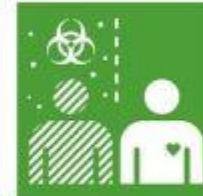
3.9. Reducir muertes por contaminación