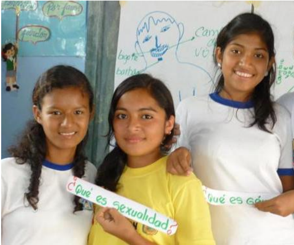
Michael McGuire. Imagen tomada del sitio Organización Mundial de la Salud. https://extranet.who.int/rhl/es/topics/adolescent-sexual-and-reproductive-health/pregnancy-prevention-2 (Fecha de actualización 22 marzo 2019)