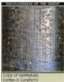
Codice de Hammurabi